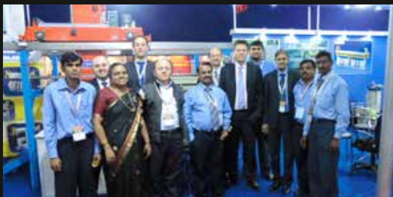
LO STAFF PROGALVANO DURANTE UNA FIERA ALL'ESTERO

Cinquant'anni di attività al servizio dell'industria galvanica. Cinquant'anni di sviluppo aziendale, crescita tecnologica e adattamento alle mutevoli condizioni del mercato globale. Progalvano Srl festeggia nel 2017 un traguardo prestigioso, frutto della dedizione e passione di tutti i suoi collaboratori che negli anni hanno lavorato sinergicamente al successo di questa realtà aziendale. Ripercorrendo la storia di Progalvano si evince come l'azienda si sia davvero specializzata nel tempo e come ambiziosamente abbia puntato al mercato globale, fino ad assumere un indiscusso ruolo di leadership. Progalvano nasce