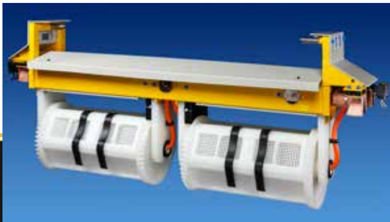
IN ALTO: ROTOR GEMELLI.